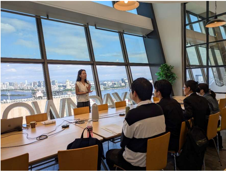
【本社メイン会議室】